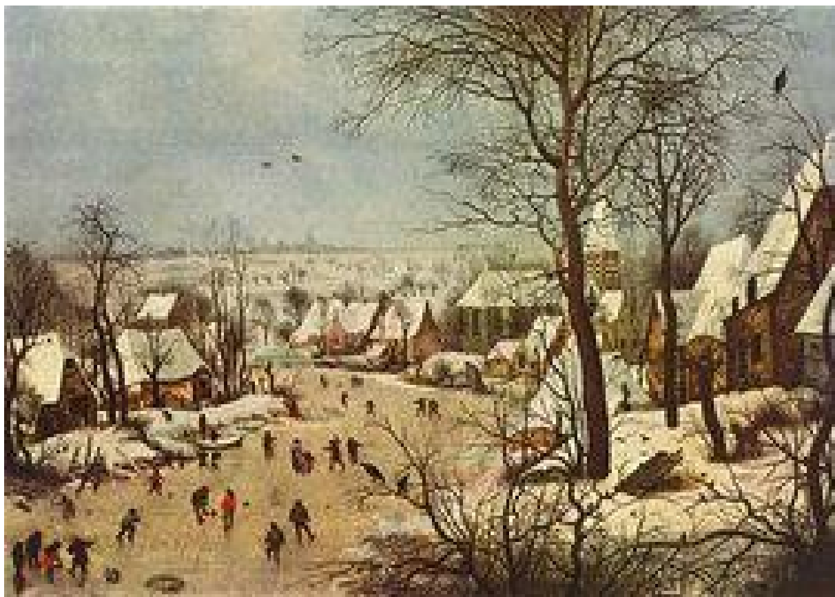
Kegljanje na ledu v preteklosti. Slika je iz leta 1565.

V naše kraje je ta šport prišel že v začetku Avstro-ogrske monarhije v glavnem na Bled, Jesenice in v Kranjski gori se je začelo kegljati v 30 letih prejšnjega stoletja. Kegelj oziroma po domače čok je bil podoben današnjemu, le da je bil lesen in okovan z železnim obročem. Takrat se je igralo v glavnem na bližanje. Nagrada pa je bila dva deci kuhanega vina, saj so bile zime zelo mrzle.